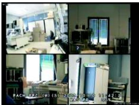
Ejemplo de pantalla de DVR DiMax S2104